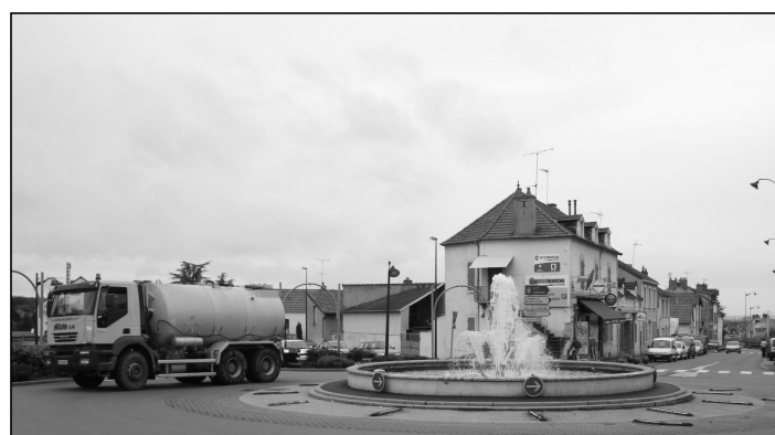
Fin 2007, avec la mise en place du contournement Nord-Est, les poids-lourds en centre-ville ne seront qu'un lointain souvenir.