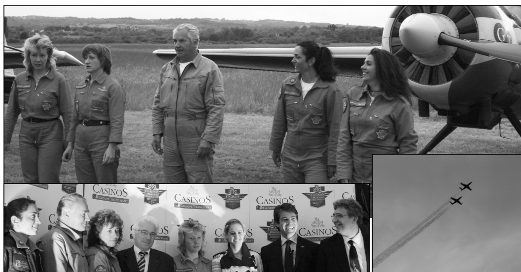
Les pilotes de choc de la patrouille aérienne du groupe Tranchant, au féminin. Ci-dessous, elles sont accompagnées des représentants du groupe Tranchant, dont fait partie le casino de Néris-les-Bains.